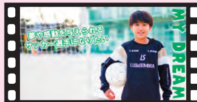
MY DREAM & MY PRIDEシリーズ