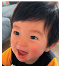
龍珠 汰郎ちゃん (1歳)

1歳のお誕生日おめでとう。 お兄ちゃんたちと一緒に健やかに成長して行って下さい。