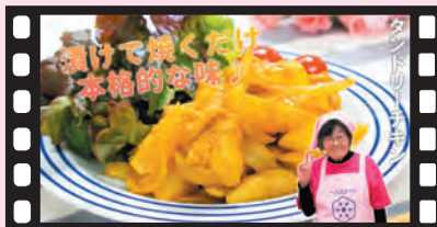
おんがめしシリーズ