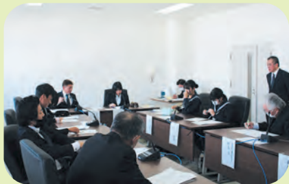
模擬委員会ではテーマについて協議