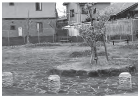
公園の地区管理が今後の課題

A 昨年の区長会でも意見があり、各区長にヒアリングを行った結果、今は何とか管理できている状況だ。しかし、今後は厳しくなることなので、公園の集約や廃止などの検討をしていく。