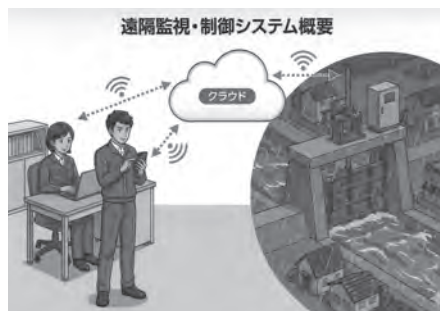
遠隔操作システムのイメージ図

作業職員の安全確保と効率化を図るため、大雨時などにおける水利施設の開閉作業を、遠隔操作できるシステムを整備します。