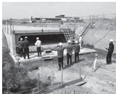
駅南地区の防災水路を整備中

土地区画整理事業が進められている駅南地区において、道路や水路などのインフラを整備します。