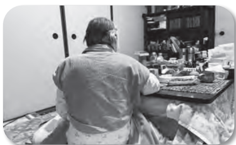
歳を重ねるごとに不安な1人暮らし

福祉課長 実態を把握することは大事なことだと思うが、1000人以上の方の調査は、今すぐできるものではない。