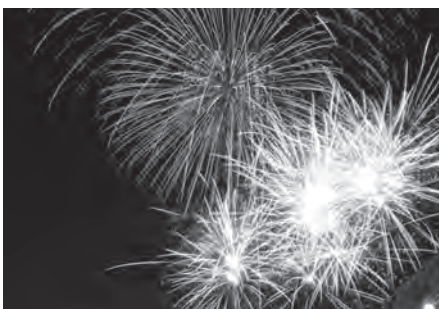
夜空を彩る過去の花火大会

令和8年度一般会計予算は、議員全員で構成する 予算特別委員会を設置し、審査を行いました。 (賛成多数可決)