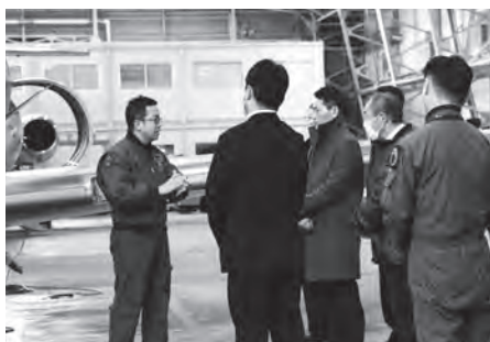
救難隊員によるU-125A 搜索機の説明