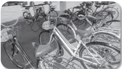
自転車駐輪場（遠賀中学校）

教育長 両中学校とも増設は難しいが、例えば自転車スタンドを設置して効率よく利用できるような整備を行うなど、限られたスペースでも収容台数を増加できるように改修方法を検討していく必要があると考えている。