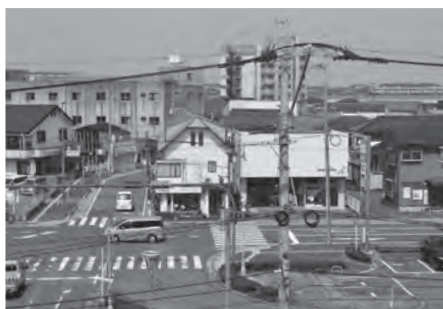
おんがみらいテラスから見た駅北側商店街