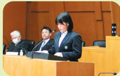
意見をとりまとめて議場で委員長報告