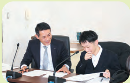
委員長役の生徒には議員がサポート