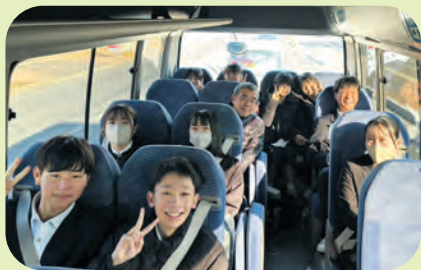
和やかな雰囲気の中バス車内

遠賀町内のバス視察後、庁舎内で町長表敬訪問、委員会室で模擬委員会、議場で委員長報告などを体験してもらうことで、議員の仕事の大切さを学ぶとともに、町の今と未来を考えてもらいました。中学生と懇談したことで、率直な意見や発想に触れ、議員も大きな刺激を受けました。