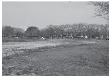
リニューアル計画がある遠賀総合運動公園

A 基本構想と基本計画を合わせ2カ年で策定を行う。全体をリニューアルすることや緑の広場は人工芝などの整備を行うため、この金額を計上している。