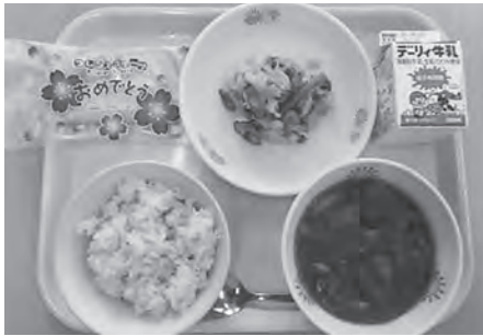
みんなの楽しい給食

子育て支援として国の小学校給食費補助に合わせ、町内中学校に通う生徒の給食費を全額補助するとともに、アレルギーや不登校、町外への就学などで補助を受けられない児童・生徒の保護者に対しても給食費相当額を補助します。