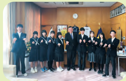
町長表敬訪問後に笑顔で記念写真