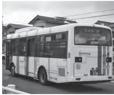
遠賀川駅と直方駅を結ぶ西鉄バス

A 直方〜鞍手〜遠賀線は重要な路線であり、西鉄バス、鞍手町、直方市、本町の4者で議論している。今後も協議しながら、補填を継続していきたい。