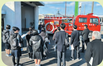
消防団の格納庫を見学