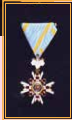
▶ 瑞宝双光章の勲章