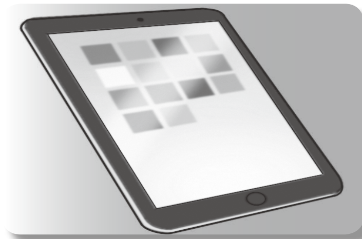
授業に活用されるタブレット