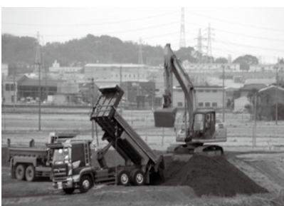
開発予定の駅南地区