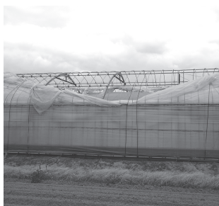
台風で剥がれたビニール