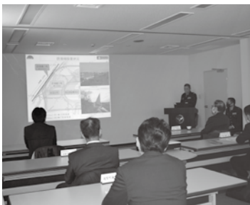
現地調査前に説明を受ける委員