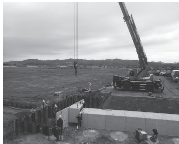
軟弱地盤対策後の設置状況

新型コロナウイルス感 染症対策による放課後等 デイサービスにおいて、 通常の利用を上回る通所