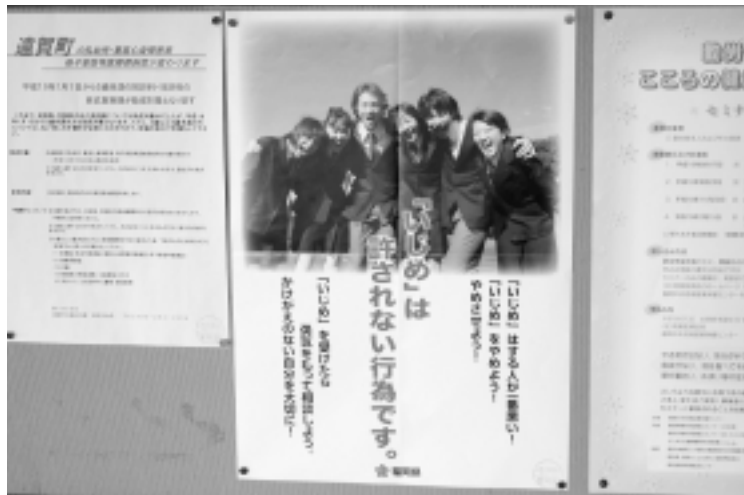
◀ いじめ防止の啓発ポスター