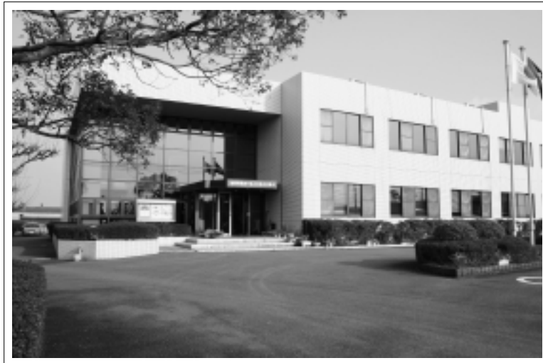
◀北九州教育事務所