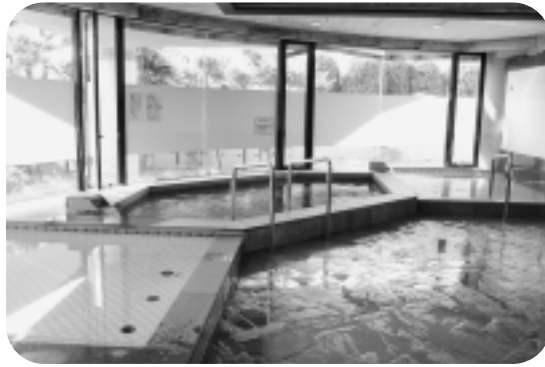
▲ふれあいの里の小浴場