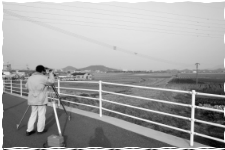
◀ 駅南街路整備事業に着手