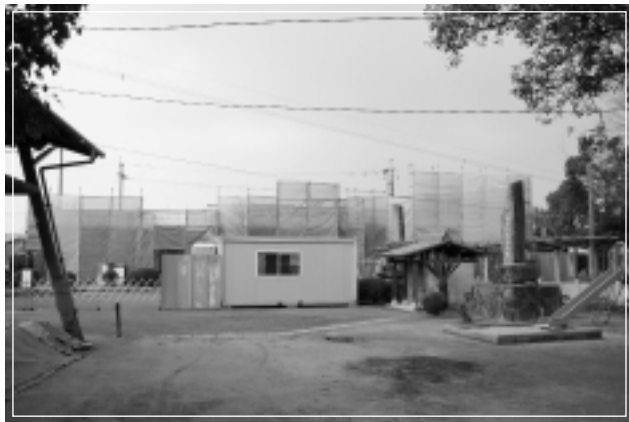
◀木守公民館改修工事の様子

条例改正により、平成19年1月1日から乳幼児医療費、重度心身障害者医療費、母子家庭医療費の往診料・初診料の公費負担の対象年齢がそれぞれ3歳以上、5歳未満まで拡大されたことに伴うもの。