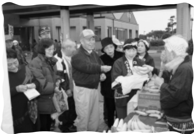
ふれあいの里で開催されている福祉まつり

平成19年4月1日から平成22年3月31日までの間、すべての管理運営を遠賀町社会福祉協議会が執り行うようになります。議会としても、住民サービスや福祉サービスの低下を招かないようにする事や外部委託の見直し、収益向上など運営の改善を指摘し可決しました。