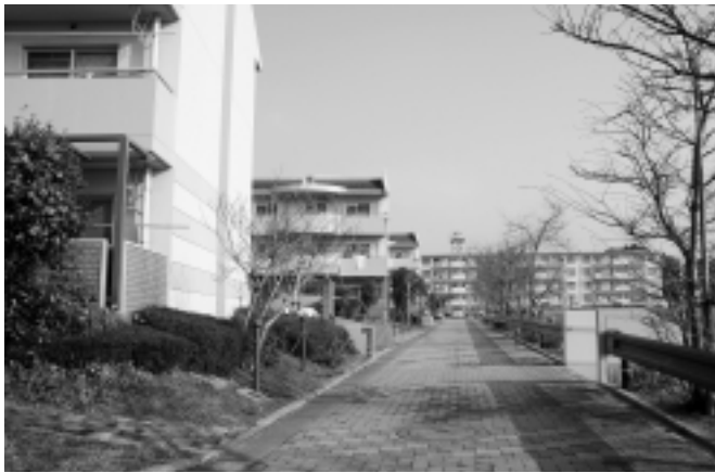
▲虫生津南の町営住宅

住宅使用料等滞納者に対し、町営住宅の明渡し、滞納賃料の支払い、訴訟費用の支払いの請求を福岡地方裁判所小倉支部に行った。