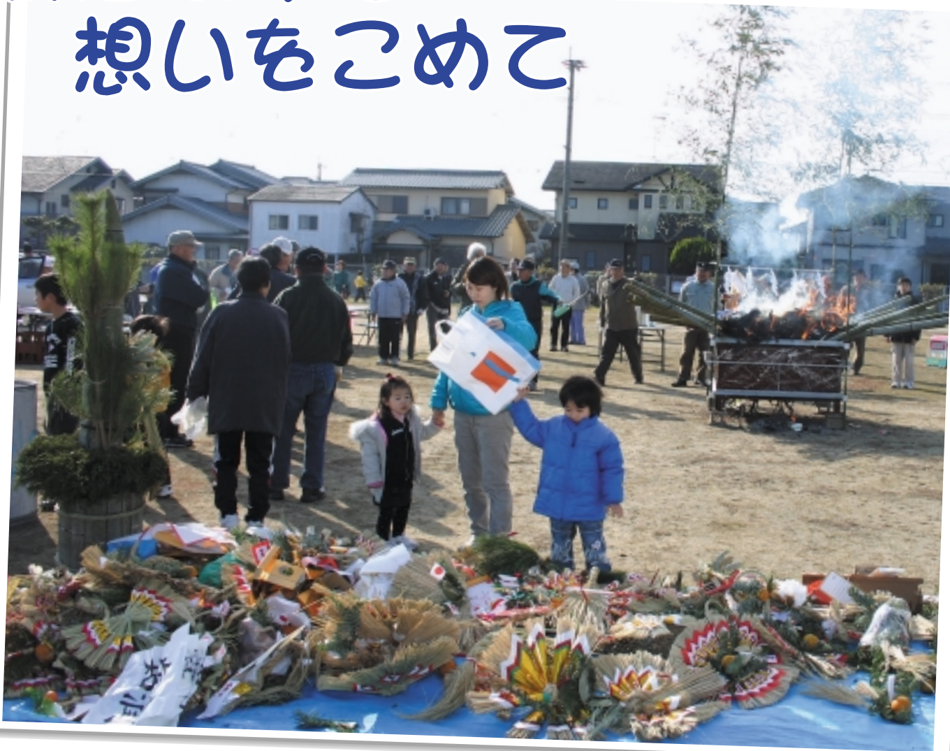
松の本地区のどんど焼き