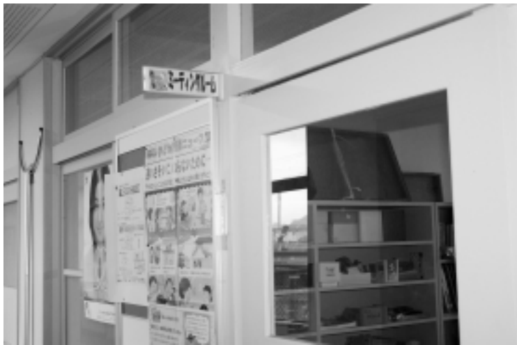
◀ミーティングルームとして活用している余裕教室

議員 近年の少子化に伴う児童生徒数の減少などにより、学校の廃校、統合や余裕教室の増加などの学校施設が発生している。本町の各学校の余裕教室の現状は。