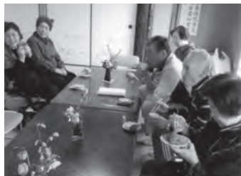
サロン活動で交流を深める

区民の融和と絆を深めるため、これまで地域全体での運動会、盆踊り大会、どんど焼きや子供会の夏のキャンプなどを行ってきました。近年では高齢化により運動会の開催をやめたものの、区民の絆を深めるため、年末の福祉餅つき大会や、公民館でのサロン活動を開催し、月に一度は旬の食べ物を楽しむ会を開催しています。