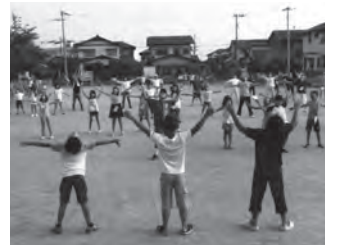
区民が集うラジオ体操

東和苑区は自治区として約40年。当初は皆若く、活気がありました。現在、高齢化率は40%を超えましたが、区の行事は変化をしながら続いています。