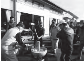
年末の餅つき大会は大勢の区民が参加

松の本区は、県道を境に東西に分かれ、古くからの集落「松の本」と、約40年前から宅地開発の行われた「ダイヤモンドタウン」からなる自治区です。