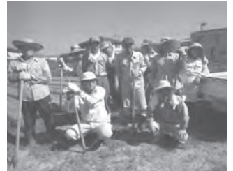
植栽に取り組む区民の皆さん

虫生津区は遠賀町の南端に位置し、鞍手町と接していて、「遠賀町」の看板を通過するときに「遠賀町は、ここが違うな」という特徴ある地域性が求められます。