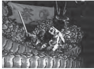
区民が楽しんだ神楽

今古賀区は自治会の加入率が非常に高く、区内にある八剣神社の秋祭り「宮日祭」を、例年10月に開催し、伝統行事の継承が行われています。10月8日に行われた宮日祭では、境内で「折尾神楽保存会」による「神楽」が奉納されました。