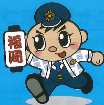
福岡県警察シンボルマスコット 「ふっけい君」