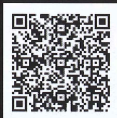
スマートフォンの方