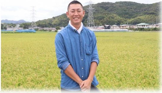
※広報おんが10月号にも特集記事が掲載されています。そちらもぜひ、ご覧ください。

そんな須藤さんの今後の活躍が農業委員会としても非常に楽しみです。地域の皆さまも温かいご支援をお願いいたします。