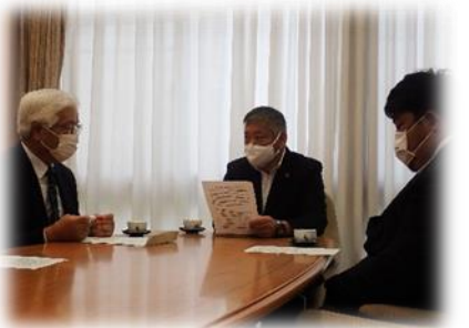
意見書提出後、意見交換を行いました。