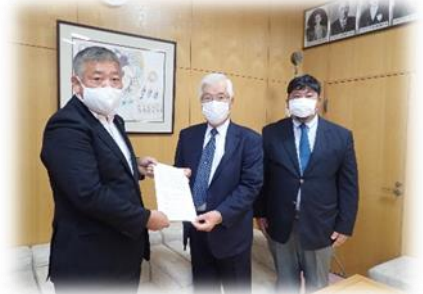
古野町長（写真左）に意見書を渡す三原会長（写真中央）と高崎副会長（写真右）