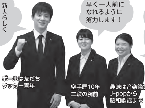
赤一丸は友だち ツツ丸は青年