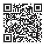
各種申請書 様式集