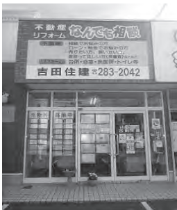
旧3号線沿い茅原信号すぐ側