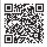
各種申請書 様式集