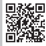
遠賀町公式 ホームページ