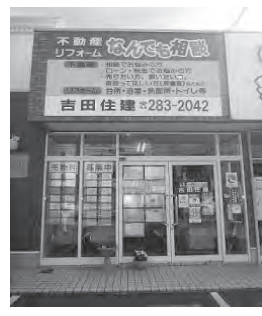
旧3号線沿い茅原信号すぐ側

吉田住建 ☎283-2042 岡垣町海老津駅前12-8 『http://yoshida-jyuuken.com』