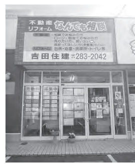
旧3号線沿い茅原信号すぐ側

吉田住建 ☎283-2042 岡垣町海老津駅前12-8 『http://yoshida-jyuuken.com』