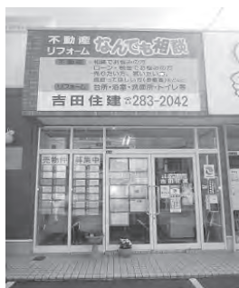
旧3号線沿い茅原信号すぐ側

吉田住建 ☎283-2042 岡垣町海老津駅前12-8 『http://yoshida-jyukuken.com』