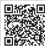
各種申請書 様式集