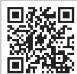
遠賀町公式 ホームページ