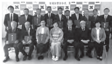
選挙管理委員と当選証書を受け取った議員の皆さん