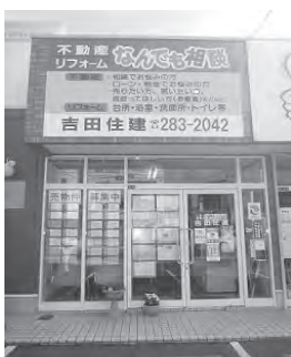
旧3号線沿い茅原信号すぐ側

吉田住建 ☎283-2042 岡垣町海老津駅前12-8 『 http://yoshida-jyuuken.com 』