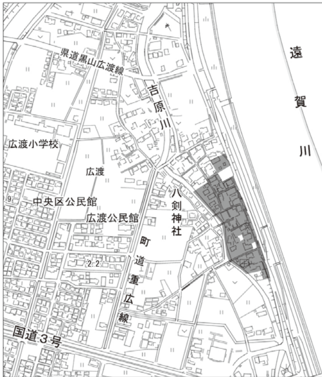
【図1】大字広渡の一部地域

下水道をより多くの人にご利用いただくと、水路や河川の水質保全と生活環境の改善につながり、下水道事業の安定した経営にも大きな効果をもたらします。早期の下水道への接続をお願いします。