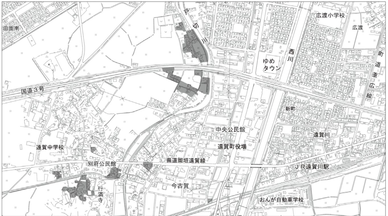
【図2】大字今古賀・別府の一部地域