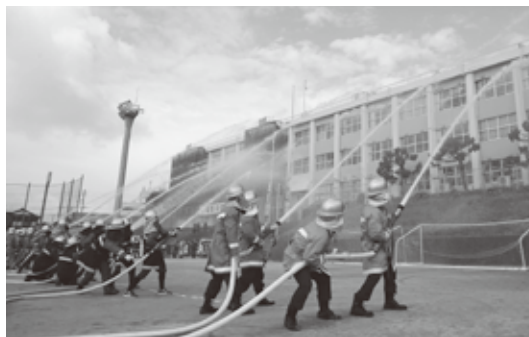
各町消防団や遠賀郡消防本部による祝賀放水は迫力満点

1月13日、芦屋中学校グラウンド(遠賀郡芦屋町中ノ浜)で、遠賀郡消防合同出初式が盛大に開催されました。参加したのは遠賀郡内各町の消防団と遠賀郡消防本部、航空自衛隊芦屋基地消防隊。消防団は「自分たちの地域は自分たちで守る」という強い使命感とボランティア精神により、地域に住む人々で結成される消防組織です。日頃の訓練成果を発揮した消防活動の展示など、その堂々たる雄姿に、来場者からは惜しみない拍手が送られました。