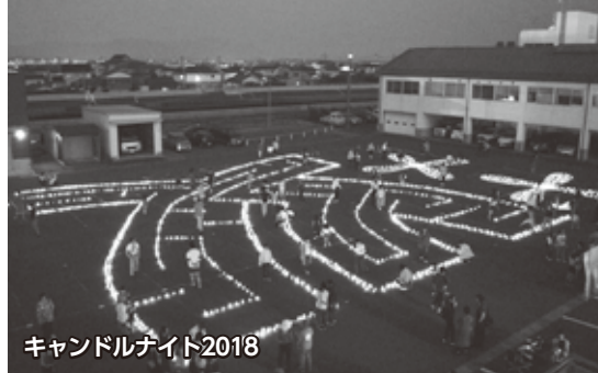
キャンドルナイト2018

審査会を行い、応募団体によるプレゼンテーションを審査します。 ※詳しい内容はまちづくり課窓口で用意している資料または遠賀町ホームページをご覧ください。