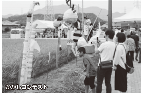
かかしコンテスト