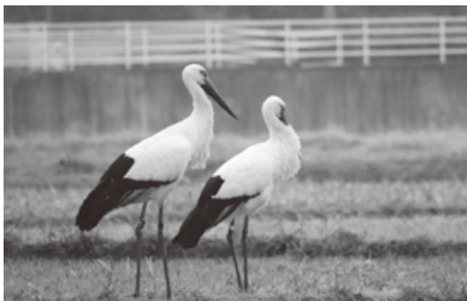
撮影した写真を遠賀町公式LINEで公開中です。ぜひご覧ください。

年末に国の特別天然記念物であるコウノトリが、遠賀町に2羽飛来しているとの情報があり、慌てて現場へ。何とかカメラに収めることができました。昭和46年に一度絶滅した国内の野生のコウノトリですが、現在は兵庫県豊岡市で、人工飼育により自然に帰す取り組みが行われています。岡垣町にも2羽飛来し、そのとき豊岡市でふ化した個体と確認されていますので、遠賀町を訪れたのもその2羽かもしれませんね。居心地が良い場所には毎年やって来るそうなので、次の来訪を楽しみに待ちましょう。