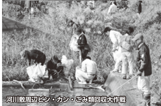
河川敷周辺ビン・カン・ごみ類回収大作戦