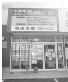
旧3号線沿い茅原信号すぐ側

吉田住建 ☎283-2042 岡垣町海老津駅前12-8 『http://yoshida-jyuken.com』