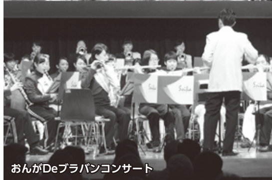
おんがDeブラバンコンサート