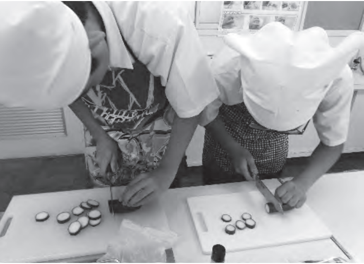
畑で野菜を育て調理をするなど作業学習にも注力(遠賀南中学校)