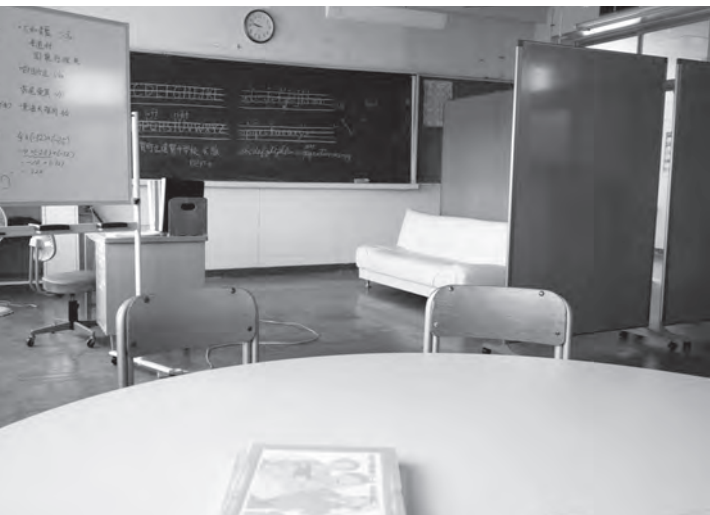
学習の困難さに応じ個別に学べる通級指導教室(遠賀中学校)