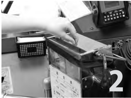
運賃箱にお金または回数券を入れます。定期券は運転手に提示してください。