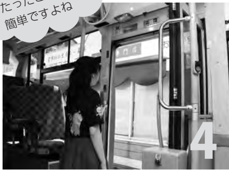
バスが停車したら、後方の扉から降ります。