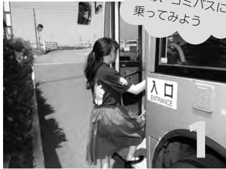
バスが来たら、前方の扉から乗ります。