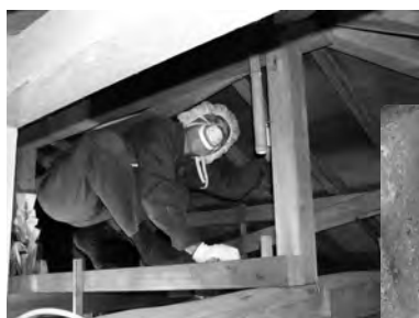
屋根裏の状況を確認