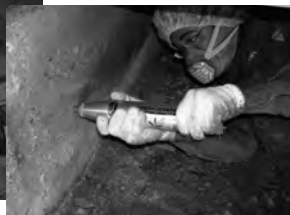
基礎の強度を測定