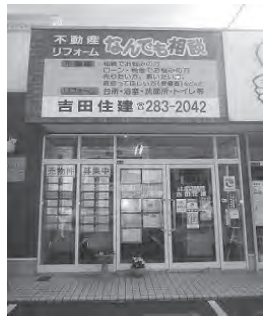
旧3号線沿い茅原信号すく側

吉田住建 ☎283-2042 岡垣町海老津駅前12-8 『http://yoshida-jyuuken.com』