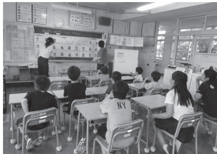
自分たちで先生にインタビューを行いマップにまとめた(広渡小学校)

遠賀町には各小・中学校に特別支援学級、遠賀中学校に通級指導教室があり、自立や社会参加に必要な力を培うため、適切な教育を行っています。