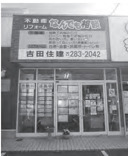
旧3号線沿い茅原信号すぐ側

吉田住建 ☎283-2042 岡垣町海老津駅前12-8 『http://yoshida-jyuuken.com』