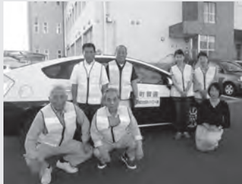
保護司の皆さんは地域の安全のため 防犯パトロールも行っています。

「社会を明るくする運動」は、すべての国民が、犯罪や非行の防止と過ちを犯した人の立ち直りについて理解を深め、犯罪や非行のない安全で安心な地域社会を築こうとする運動です。