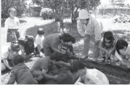
人権擁護委員と一緒に種まきをしました

毎年町内の一つの小学校で人権擁護委員と一緒に人権の花ひまわりを育てる活動をしています。今年は島門小学校の3