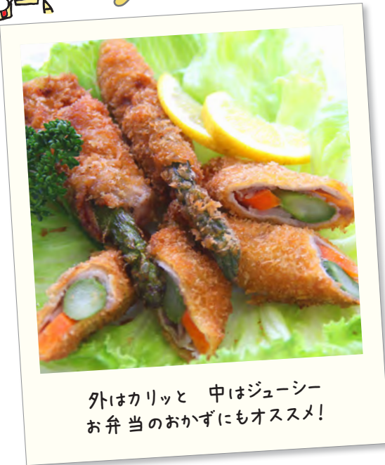
外はカリッと 中はジューシー お弁当のおかずにもオススメ!