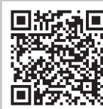
各種申請書 様式集