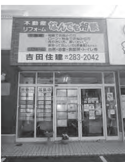
旧3号線沿い茅原信号すぐ側