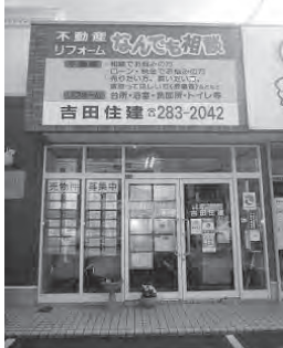
旧3号線沿い茅原信号すぐ側