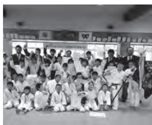
遠賀少年柔道クラブの皆さん