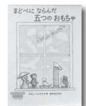
『まどべにならんだ五つのおもちや』