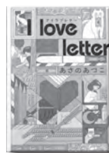
『I love letter』