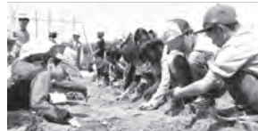
暑い中がんばりました(4月の種まき)