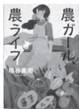
『農ガール、農ライフ』

叔母さんが経営する文通会社で働き始めた岳彦。岳彦は手紙でしか解決できない事件と向きあい成長していく。