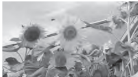
花言葉は「あなたは素晴らしい」 まもるくんの登場にみんな大興奮