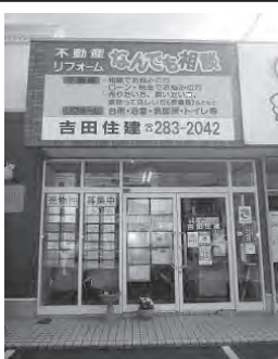
旧3号線沿い茅原信号すぐ側