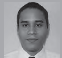
from ALT Chance Griffin