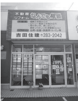
旧3号線沿い茅原信号すぐ側