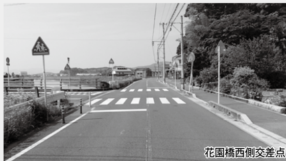
花園橋西側交差点

※手紙の回答後、警察との協議が整い、交差点北側の横断歩道部に押ボタン式信号が設置されることになりました。