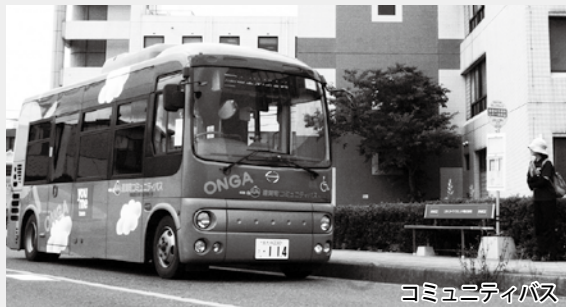
コミュニティバス

現在コミュニティバスは2台のバスで、町の北部と南部をカバーするように運行しています。南部の路線である虫生津・浅木快速線の朝の通勤・通学時間帯は、同時帯に西鉄バスが白水橋バス停～遠賀川駅バス停区間を運行しているため、西鉄バスの運行状況を確認しつつ、運行しています。町南部の増便となれば、町北部の減便が必要となるため、町全体のバランスを考慮した慎重な検討が必要です。限られた台数のバスで、より効率的、効果的な運行となるよう取り組んでいますので、ご理解、ご協力をお願いします。