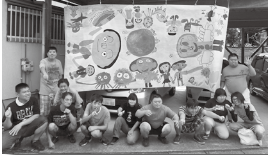
「障がい者YYくらぶ」の皆さんと受賞作品「平輪」

八幡西区三ヶ森の金山川河岸で開催された第20回金山川アートギャラリー。毎年、巨大な絵画が川岸に並ぶ光景が地域住民や通行人の目を楽しませています。10月10日に「金山川ふれあいまつり」の中で、アートギャラリーコンテスト入賞者の表彰式が執り行われ、NPO法人「障がい者YYくらぶ」の皆さんの作品「世界遺産で広がる平輪」が北九州市議会議長賞に選ばれました。