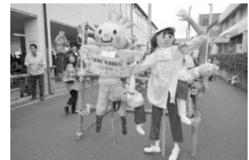
～昨年のかかしコンテストの様子～