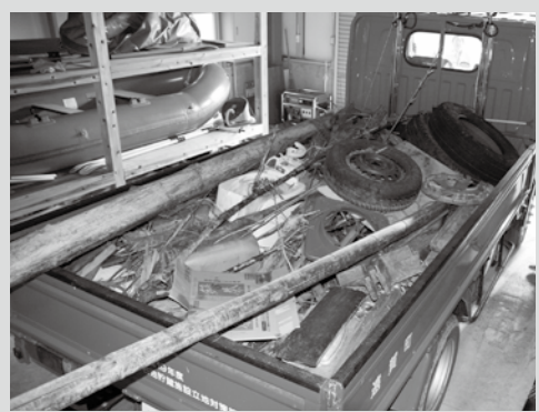
6月12日の「リブアース・クリーンアップ遠賀」で集まった粗大ごみです。

▽遠賀川に関するお問い合わせ 遠賀川河川事務所河川環境課 ☎0949(2)18300