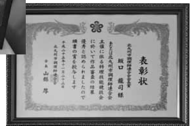
今までに受賞された賞のメダル(上)と今回受賞された賞状(右)など