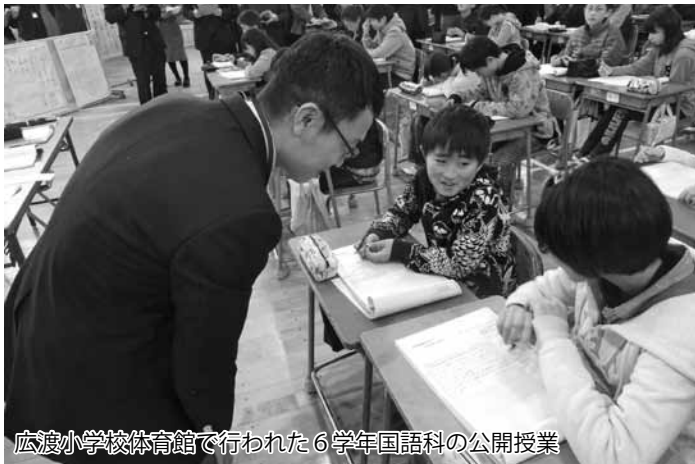
広渡小学校体育館で行われた6学年国語科の公開授業

いま、遠賀町では、福岡県教育委員会の研究指定・委嘱を受け、すべての子ども達が不登校にならず生き生きと学ぶ「おながスマイルスクールプログラム」の作成を目指し、小中連携事業に取り組んでいます。その経過報告会が1月27日に、広渡小学校で開催されました。