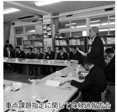
重点課題指定に関する経過報告会

報告会場に集まった関係者からは、この研究指定・委嘱を契機に不登校 ゼロ を目指す熱い思いが感じられました。