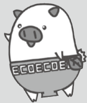
福岡県マスコットキャラクター「エコトン」