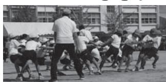
広渡小学校の運動会の様子

みんなで築こう 人権の世紀 「12月1日は世界エイズデー」 HIV・エイズに対する誤解と偏見をなくすために