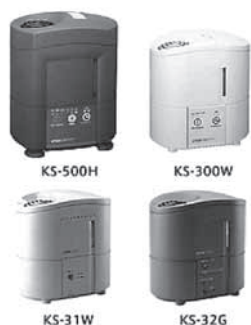
機種名は、本体全面のTDKマークの右側および裏面のラベルに表示してあります。