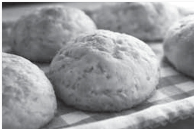
焼たての青米パン。写真では分かりづらいですが、淡い色の粒が青米です。