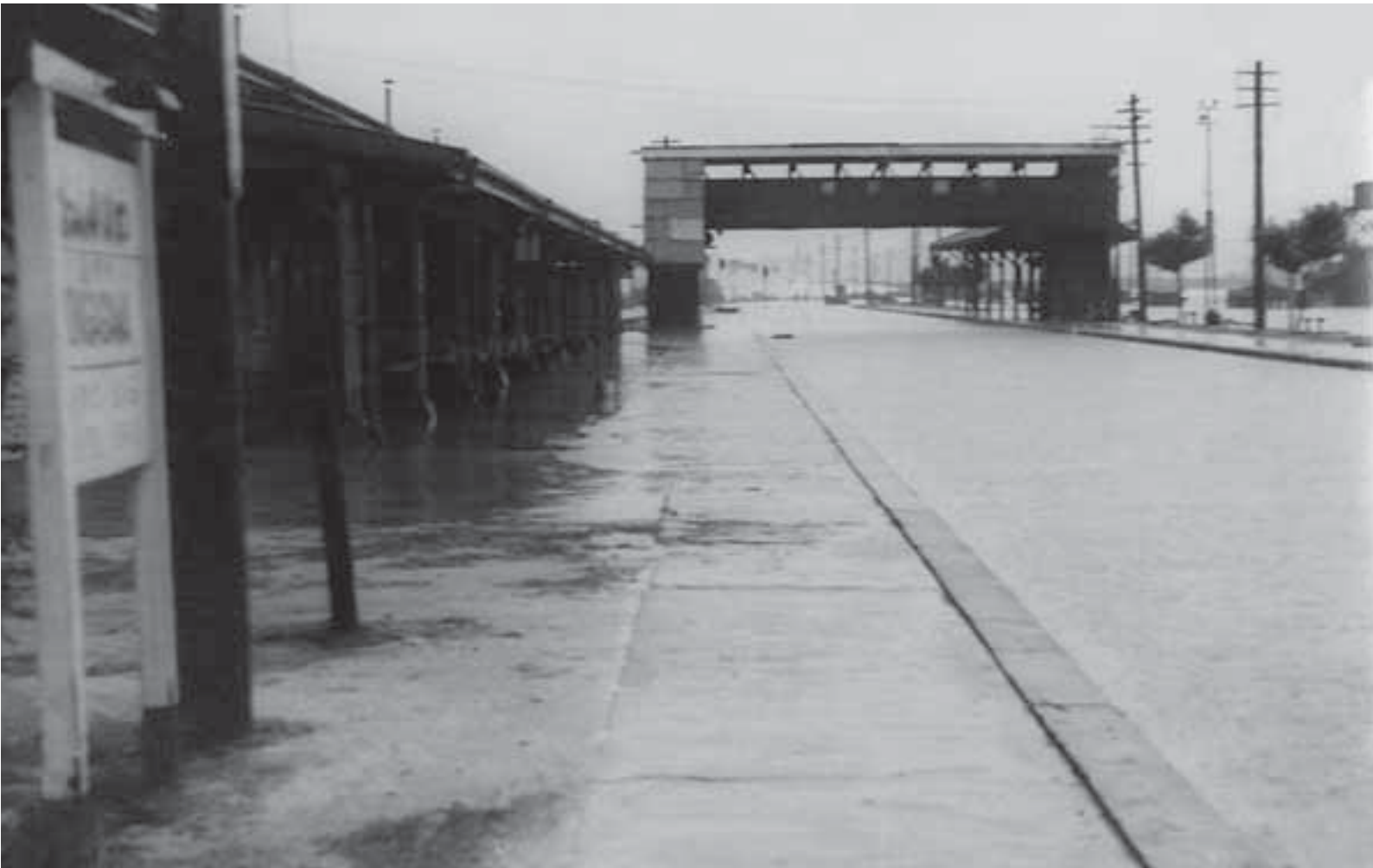
↑ 水害時の遠賀川駅の様子を写したものです。写真右のまるで川のようになっているところが、線路のあるところ。陸橋の位置などから、現在の遠賀川駅を想像して当てはめて見ると、かなり水没しているのが分かります。