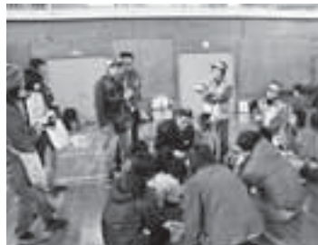
↑今年3月11日に行われた、「避難所でサバイバルin遠賀」の様子

無理な避難を試みて、かえって危険な状態になるより、2階にあがるなど安全な場所へ移動しましょう。安全を第一に考え、落ち着いて救助を待ちましょう。