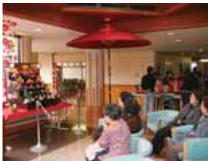
ひなまつり茶会の様子

ふれあい ひなまつり茶会 お茶会とふれあいステージを開催します。ちりめん細工やさげものの展示、焼きたてパンの販売も行います。 【お茶会】 ●とき 3月3日(土)午前10時30分～午後0時15分、午後1時～2時45分 ●茶券 300円(抹茶・菓子・入館割引券) ※ふれあいの里センター窓口で販売しています。 【ふれあいステージ】 女声コーラス風「コンサート」 全日本おかあさんコーラス全国大会で「おかあさんコーラス賞」を受賞した美しい歌声をお楽