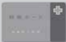
献血カードをお忘れなく

●とき 11月11日(金)午前10時〜午後4時 ※正午から午後1時まではお休みです。