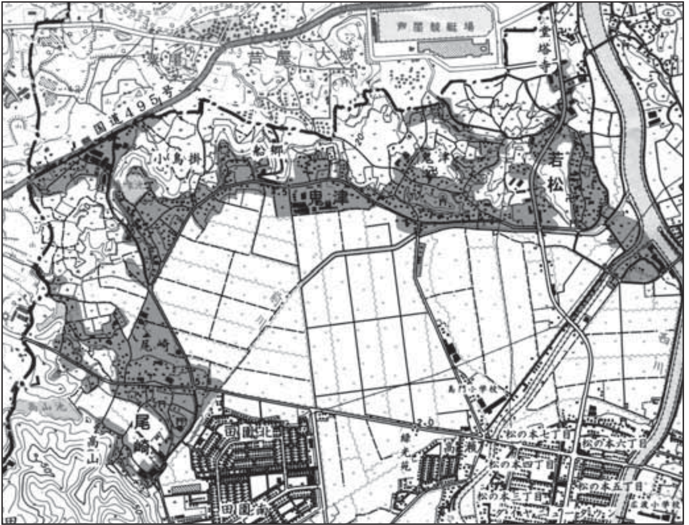
遠賀北部地区(鬼津・尾崎・若松)の農業集落排水処理区域

※そのほか、雨水・土砂・油類・薬品・農薬、45度以上のお湯・髪の毛、糸くず・布きれなどは流さないでください。