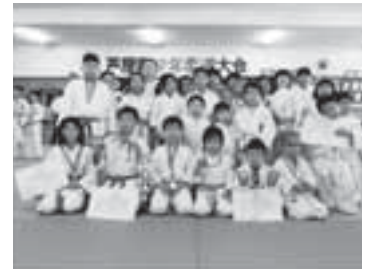
遠賀少年柔道クラブ