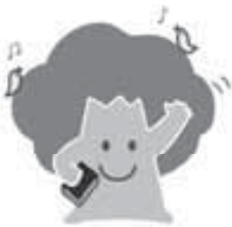
図書館イメージキャラクター ウッディ君