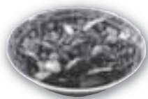
超スピーディー いりこおやつ