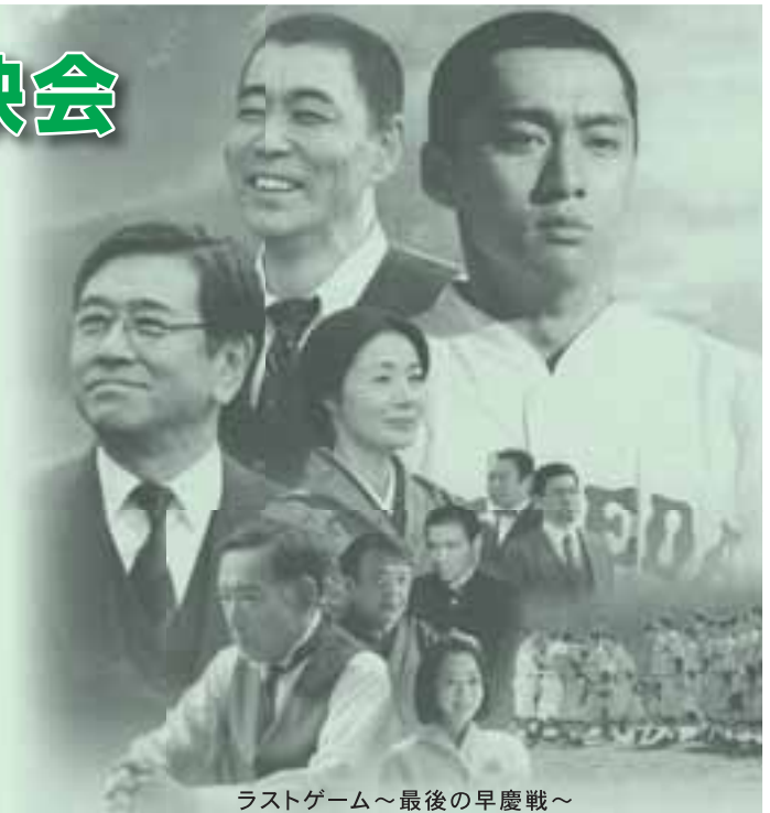
ラストゲーム～最後の早慶戦～