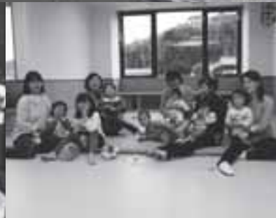
福祉のまちづくり