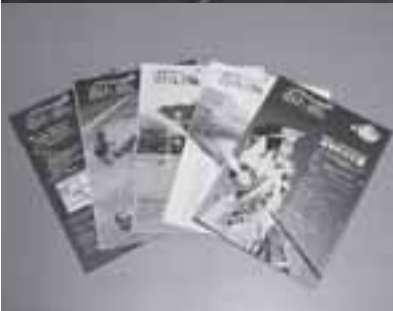
開かれたまちづくり