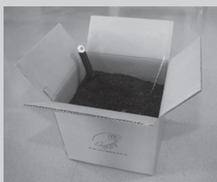
ダンボールコンポスト

ダンボールコンポストとは、ダンボール箱に土壌改良剤のピートモスともみがらくん炭を入れ、生ごみを微生物の力で肥料にするものです。3か月程度で良質な堆肥ができます。