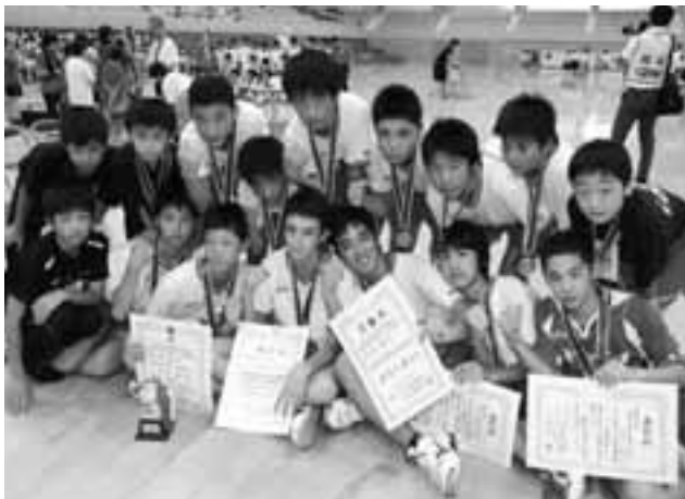
大会後の記念撮影

遠賀中学校男子バレー部が「第40回全日本中学校バレーボール選手権大会」で、見事準優勝に輝きました。全国の地域予選を勝ち抜いた35校に、開催県の岡山県代表を加えた36校が、岡山県総合グラウンド体育館などで熱戦を繰り広げました。