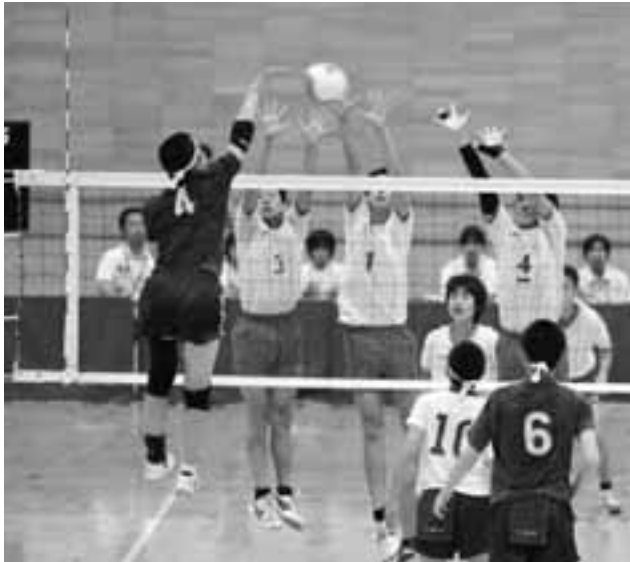
緊迫したネット際の攻防