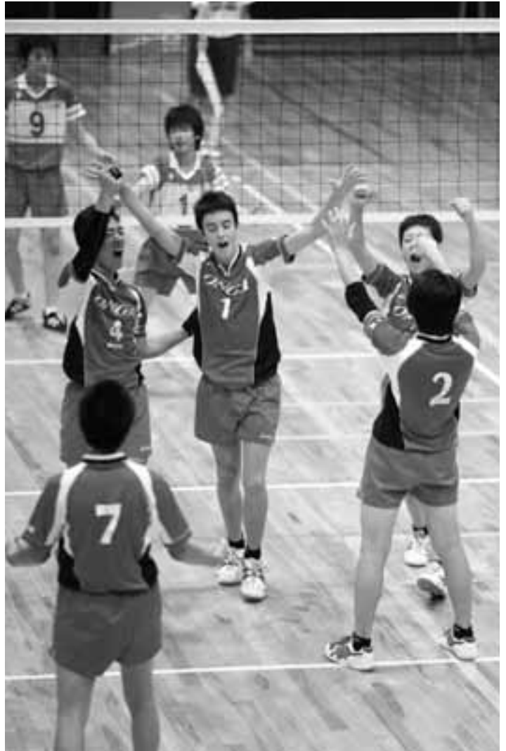
ブロックを決めてチームは上昇ムードへ