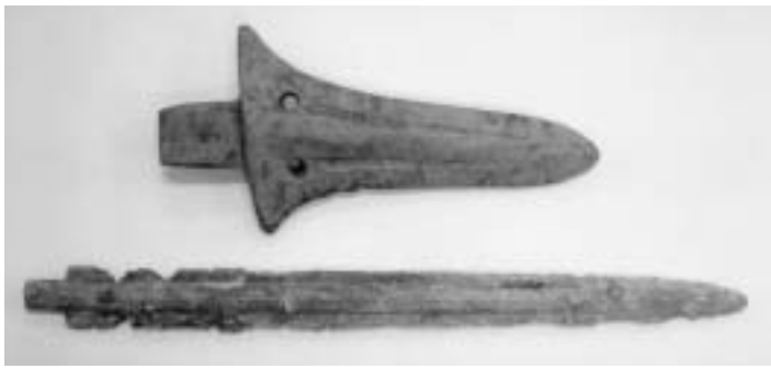
磨製石戈(上)・細形銅剣(下)

遠賀町教育委員会では、平成21年4月1日に、遠賀町内の発掘調査で出土した考古資料のうち、歴史的・学術的に価値の高い3件の物件を、新たに遠賀町指定文化財に指定しました。