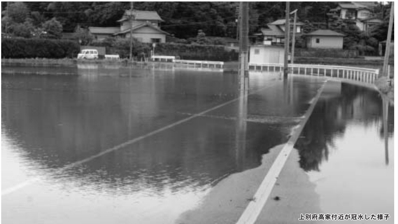
上別府高家付近が冠水した様子