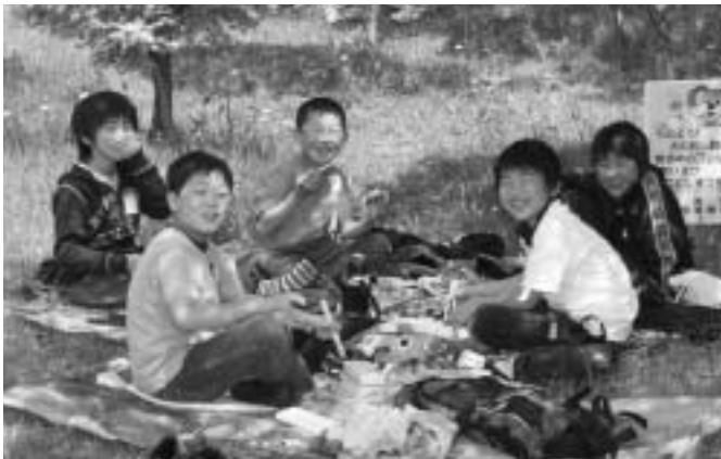
外で食べるお弁当の味は、また格別！（島門小学校）