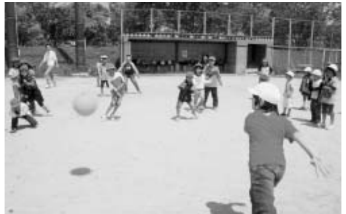
ドッチボール、当てられないように逃げろ～！（広渡小学校）