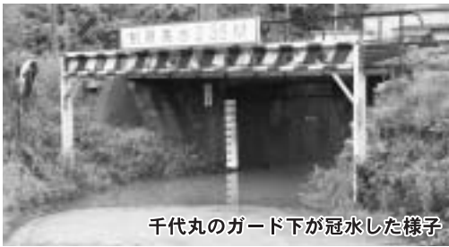
千代丸のガード下が冠水した様子