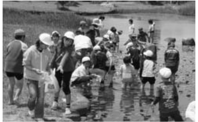
授業で使う「めだか」探しにみんな必死！（浅木小学校）

入学して1か月が経った新入生たちも、そろそろ学校に慣れて、新しい友達もできたはず。この日は、天候にも恵まれて、遠足には絶好の1日だったのではないのでしょうか。