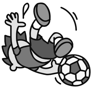
おながサッカークラブ

募集 このコーナーでは、県大会以上の輝かしいスポーツの結果を募集しています。広報調整係に連絡してください。