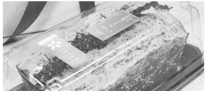
▲芳香赤しそのパウンドケーキ