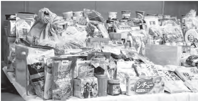
遠賀信用金庫と地域から、えがお食堂への贈り物