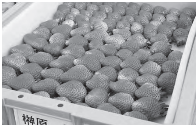
収穫された「あまおう」