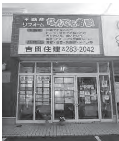
旧3号線沿い茅原信号すぐ側