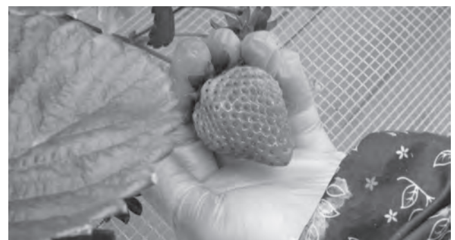
8割程度の熟成度で収穫