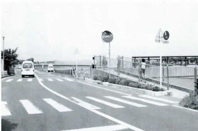
広渡小学校の児童の多くが利用する、出会いのかけ橋出口(松の本側)

Q 出会いのかけ橋出口(松の本側)でよく車が急ブレーキをかけるのを見かけます。いつか歩行者がひかれるのではないかと心配ですので、信号機をつけてください。