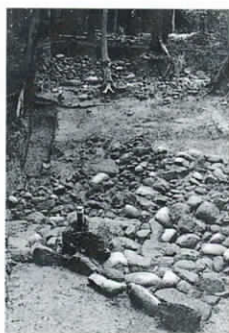
西側くびれ部の葦石

古墳は、まず、地表面を整形した後2m以上も土を盛り上げますが、盛土自体の重さが地滑