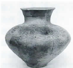
慶の浦遺跡から出土した壺

その祭りで使われる壺などの表面に、心情を反映した様々な文様が描かれます。当初は、焼きあがった土器の表面に赤いペンガラで文様を描いた彩文土器でした。その後は、ヘラや貝殻で文様が描かれた土器に変化していきます。写真の土器は慶の浦遺跡から出土した壺で、口の内側には黒色の文様、外面には貝殻で丁寧に描かれた羽状文があり、弥生人の繊細な感性が汲み取れます。