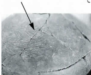
片面のみにある文様

地域ごとに文様は異なります。その文様は部族の紋章であったと考えられ、部族間の交流により文様も変化していったようです。壺に描かれた文様は様々な考え方ができ、多くの謎も秘めています。