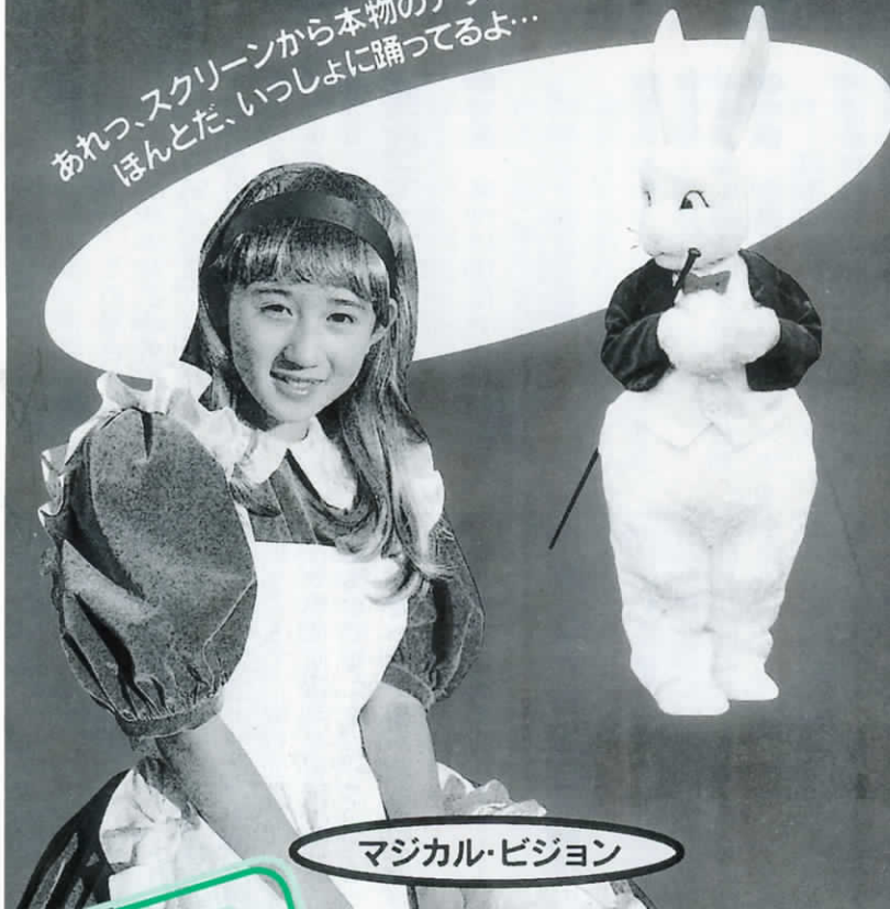
マジカル・ビジョン