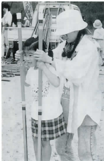
イチ、二、イチ、二、と竹馬に乗る女の子。「お母さん、しっかり持ってね」がんばれ、がんばれ！