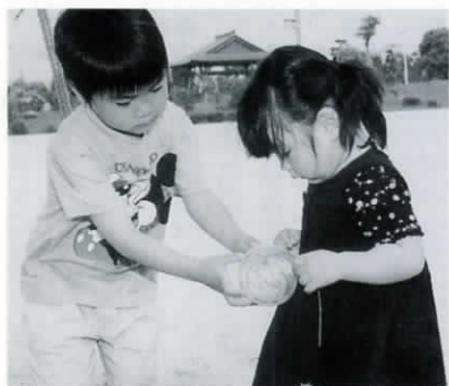
「ほら、しっかり持ちなよ」とヨーヨー釣り場での二人組。仲よし兄妹かな。

とっても暑い、暑い、暑い〜っ。こんな日は「かき氷」にかぎるね。冷たいかき氷に頭がズキン。この瞬間が極楽だよ。