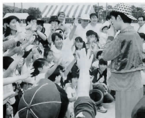
ハイハイハイと大盛況のピエロの大道芸。二人のピエロさんのコミカルな手品や話術に会場は笑いの連続でした。ピエロさんの作った風船の動物、これなーんだ。