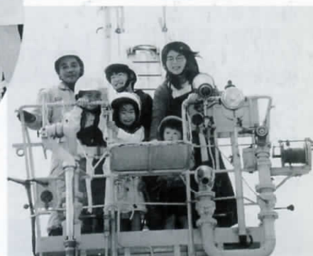
消防車に乗って人命救助だ！とばかりに空高くのぼっていく子どもたち。この日は、はしご車とスノーケル車がたくさんのおともを十数メートルの上空に運んでくれました。感想を聞いてみると、「すずしくて気持ち良かった」とか「人が豆粒みたいに見えた」とか満足いっぱいの答えでした。

とっても暑い、暑い、暑い〜っ。こんな日は「かき氷」にかぎるね。冷たいかき氷に頭がズキン。この瞬間が極楽だよ。