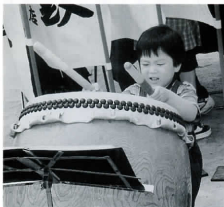
ドンドコドン、ドンドコドン。かわいい太鼓の生演奏。じょうずに太鼓をたたけたかな。